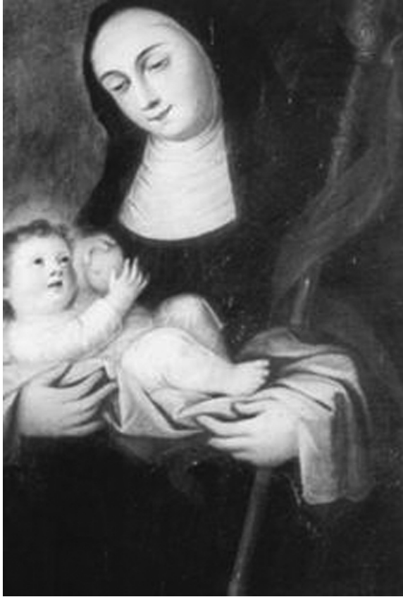
Figura 1. Santa Gertrudis amamanta al niño Jesús. Iglesia de la Soledad. Ciudad de México.

La nueva devoción fue impugnada por los dominicos y, sobre todo, por los jansenistas, grandes enemigos de los jesuitas, que estaban en contra de las visiones místicas y de la comunión frecuente. El mismo papado se mostró reticente para aceptar el nuevo culto, que no fue aprobado oficialmente hasta 1765 por Clemente XIII, a dos años de la expulsión de los jesuitas del imperio español. Aunque el tema no era nuevo —se remontaba, como vimos, a las monjas visionarias del siglo XIII como Gertrudis de Helfta—, su representación cambió profundamente desde fines del siglo XVII, como lo ha mostrado Leonor Correa, pues de ser un mero objeto metafórico se convirtió en una víscera, con sus venas y arterias, bajo la influencia de los nuevos descubrimientos de Harvey sobre el sistema circulatorio 52 . Esa misma relación entre ciencia y arte se ve en el tratamiento dado al heliocentrismo que, como lo han mostrado Víctor Mínguez e Inmaculada Rodríguez, sin estar abiertamente aceptado fue utilizado de manera exhaustiva como metáfora de la monarquía terrenal y, por extensión, de la celestial 53 . Cristo era representado como el sol de justicia y centro del universo que iluminaba todos los planetas, atribución basada en una profecía de Malaquías (4,1). En un caso similar estaban las imágenes de María Inmaculada, en las que aparecía la luna con sus cráteres, observados desde los tiempos de Galileo por medio del telescopio.