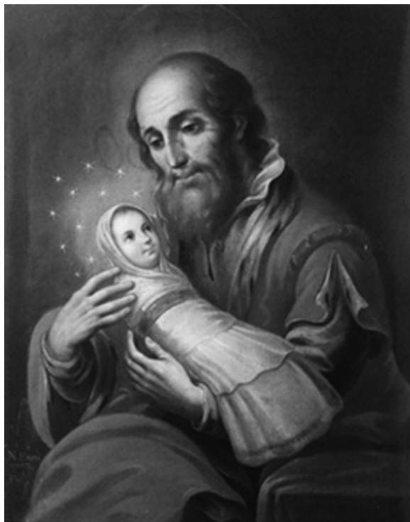
Figura 5. San Joaquín carga a la Virgen Niña. Nicolás Enríquez. Museo Nacional del Virreinato, Tepotzotlán, Estado de México.

absurda (pues María había nacido con la ciencia infusa y con una sabiduría ingénita), el tema tuvo una cierta difusión en España y América y refleja la nueva actitud hacia la educación femenina 58 .