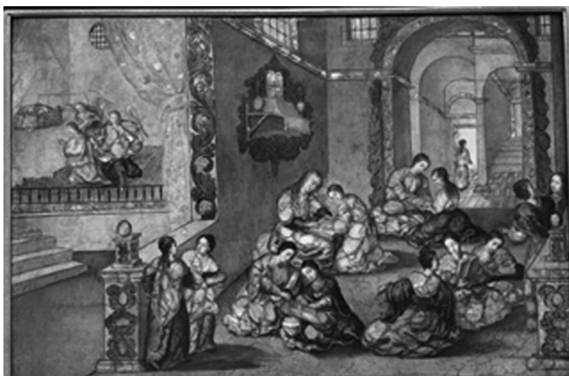
Figura 4. Cuadro enconchado sobre la educación de María. Anónimo. Museo LACMA. Los Ángeles, EE.UU.

siendo representado desde el Renacimiento, a partir del Barroco las decoraciones interiores del recinto donde estaba la recién parida se volvieron más cercanas a aquellas de las casas de los ricos 57 . Por último, desde el siglo xvii comenzó a difundirse la escena en la que santa Ana enseña a leer y escribir a la Virgen niña en un cómodo y acogedor ambiente doméstico lleno de cojines y rico mobiliario. A pesar de que el tratadista español Francisco Pacheco condenó esa representación en su Arte de la pintura por parecerle