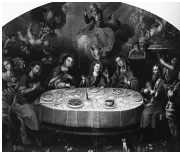
Figura 2. Banquete de Jesús con sus padres y abuelos. Luis Berruero. Catedral de San José de Tula, Hidalgo. Tomado de: Varios autores. Parábola novohispana. Cristo en el arte virreinal . México: Banamex, 2000, p. 58.