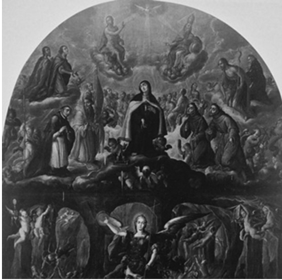
Figura 6. Cuadro de ánimas con santa Teresa con birrete y san Miguel. Detalle. Cristóbal de Villalpando. Iglesia de Santiago, Tuxpan, Michoacán. Tomada de: Varios autores. Cristóbal de Villalpando . México: Banamex, UNAM, 1997, p. 322.

los fieles 61 . En cuanto al ejercicio de la teología universitaria, que implicaba la obtención de grados, desde muy temprano en el siglo XVIII los carmelitas novohispanos comenzaron a representar a santa Teresa con el birrete doctoral propio de los teólogos, notable en una orden que nunca tuvo presencia universitaria y en una santa a quien la Iglesia concedió el grado de doctora hasta el siglo XX (fig. 6). Hay incluso grabados y pinturas que la representan como madre de la Iglesia, equiparándola a san Agustín o santo Tomás. Muy posiblemente gracias a su influjo se hizo cada vez más común representar a santas escritoras (Catalina de Siena, Catalina de Alejandría y sor María de Ágreda), un tema iconográfico imposible cien años atrás. Por último, a pesar de que las mujeres fueron excluidas de la predicación pública, hay grabados franciscanos en los que la madre Ágreda se muestra predicando a los indios, remembrando una visión que la misma monja contó a uno de sus confesores franciscanos y que se difundió enormemente en Nueva España, como parte de los discursos promocionales de la labor misionera de los colegios de Propaganda Fide 62 .