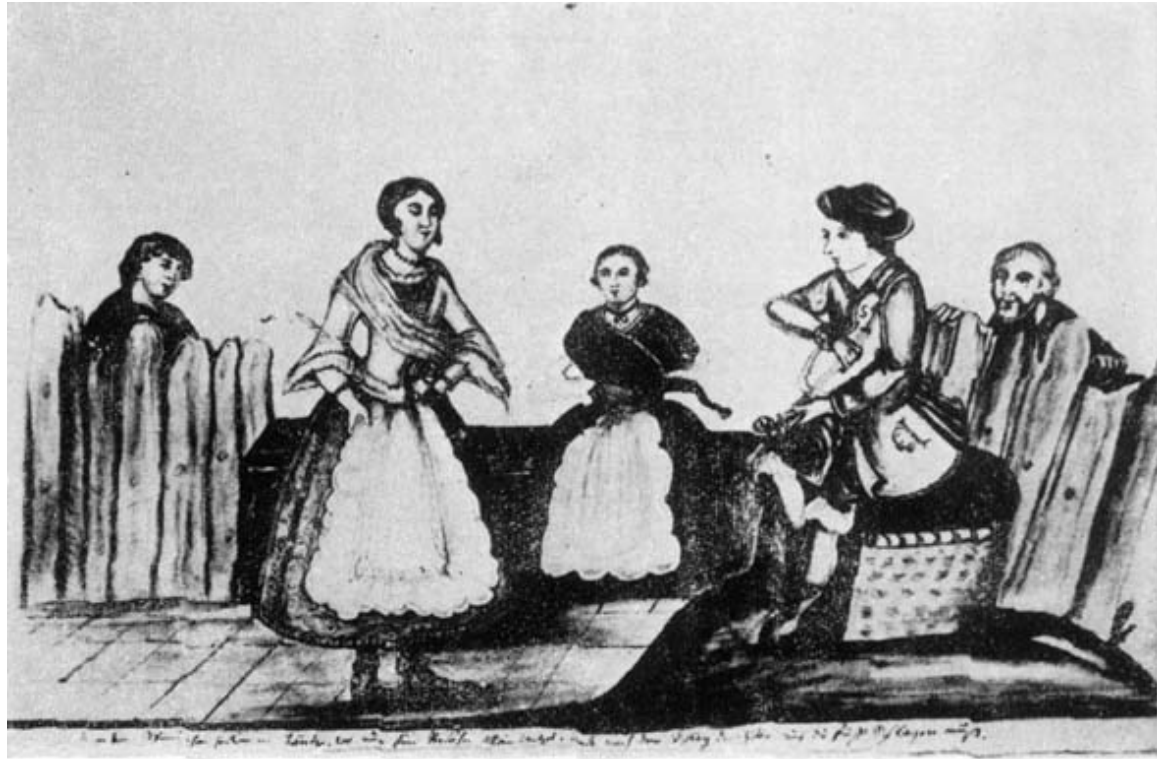
Una fiesta de criollos.